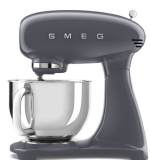
SMF03GREU Slate Grey