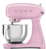
SMF03PKEU Cadillac Pink